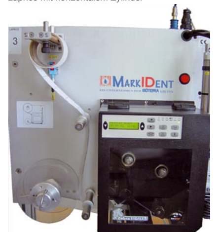
Variante mit seitlicher Rollenführung