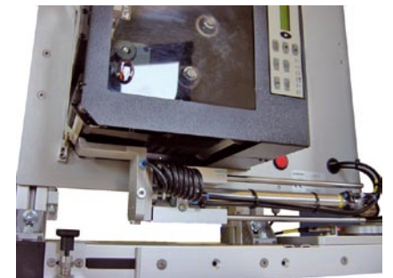
Laprice mit horizontalem Zylinder

MarkIDent stellt geeignete Softwareprodukte u. a. zur Gestaltung von Barcode-Etiketten und Bereitstellung des Zugriffs auf vorhandene Datenbanken zur Verfügung.