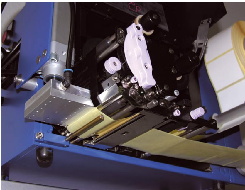
Übergabepad und Druckereinheit